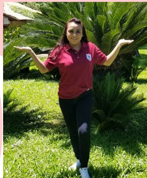
Flor en el Colegio Zonal para Soldados

(Tomado de Central Connection, septiembre 2019, p.4)