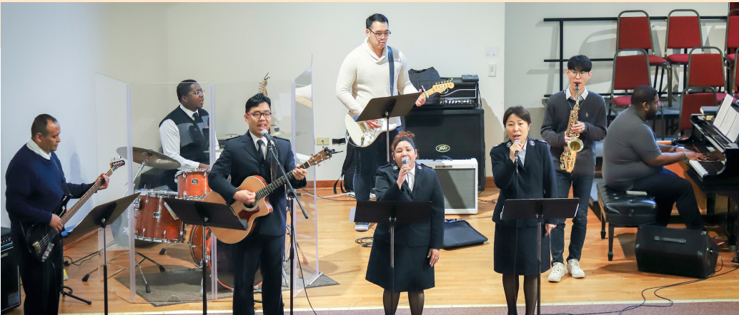
Durante un servicio unido miembros de cada congregación están representados en el grupo de alabanza