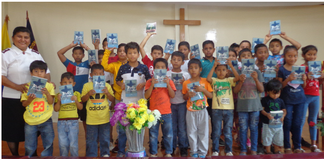
Entrega de Biblias a niños

En Josué 1:9 «Mira que te mando que te esfuerces y seas valiente, no temas ni desmayes, porque Jehová tu Dios estará contigo en donde quieras que vayas». Deseo grandes bendiciones para cada uno de los que leen su palabra.