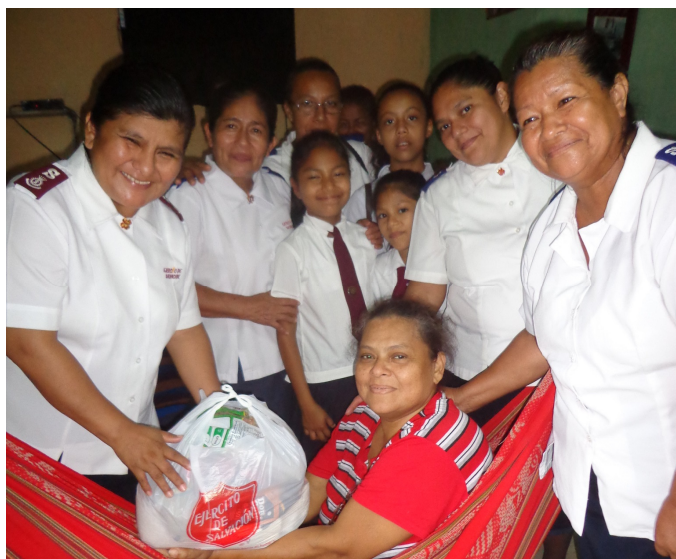
Visita a una hermana de la Liga del Hogar

Mientras tanto, mi esposo llamaba insistentemente al número de teléfono que se había designado para solicitar asistencia médica de un hospital a los contagiados del Covid19. Tomé el teléfono y le mencioné los síntomas que tenía. El doctor me dijo: «Señora, con los síntomas que usted tiene, solo puede ir al hospital del