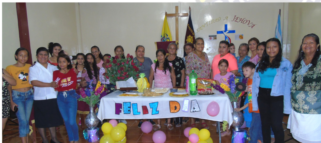
Liga del Hogar del Cuerpo Flor de Bastión